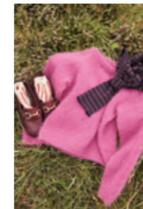
DEBUTANT SWEATER Tynn Silk Mohair x2 Design 7