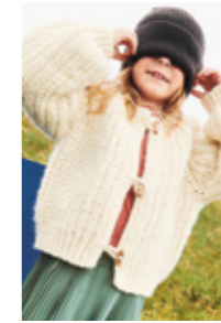
CHUNKY JAKKE Fritidsgarn + Kos Design 3