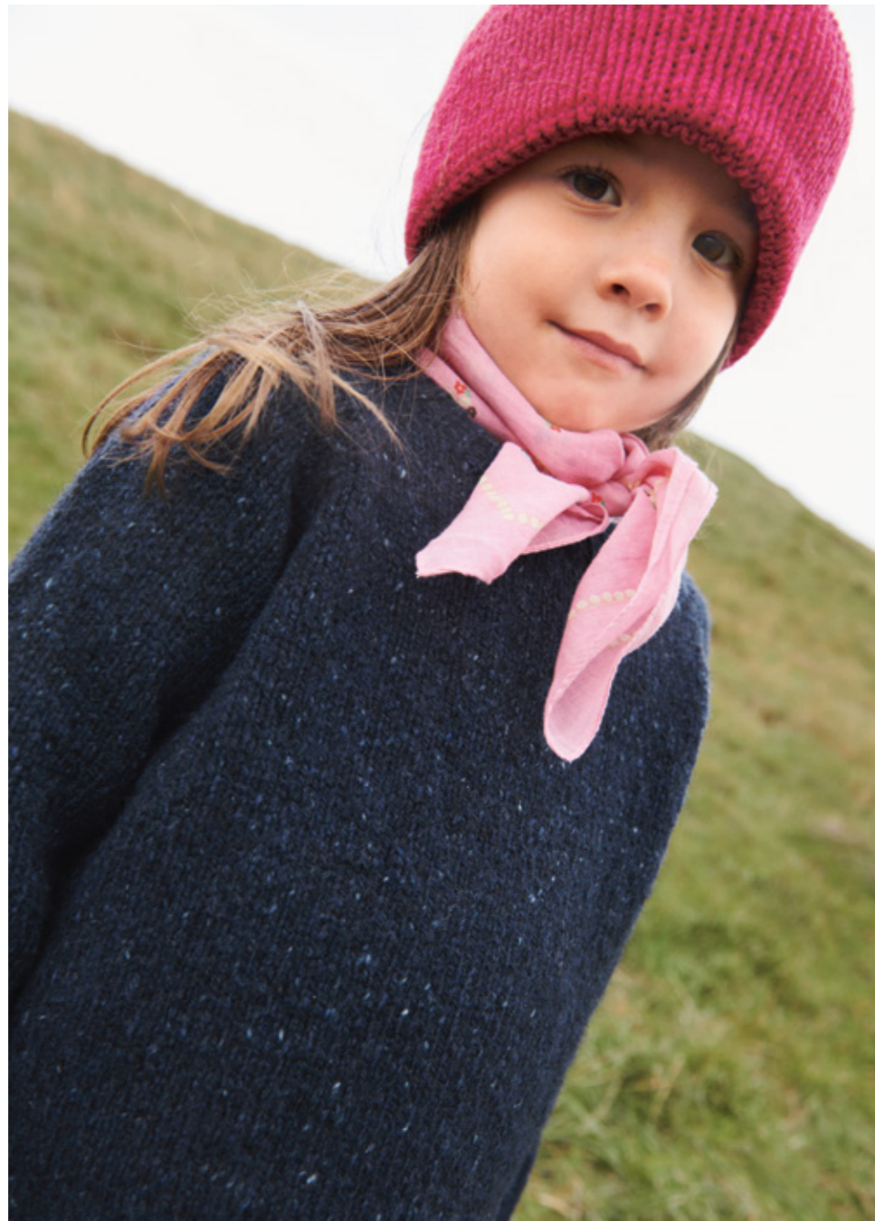
2309 | TWEED RECYCLED | \times 3½ | \frac{\text{AAA}}{21 | 10} | • DEBUTANT SWEATER TWEED EDITION 10A OGB | 2-12 ÅR (ovenfra og ned eller nedenfra og opp)