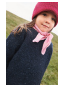
DEBUTANT SWEATER TWEED EDITION Tweed Recycled Design 10