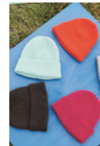
MUST-HAVE BEANIE Double Sunday Design 5