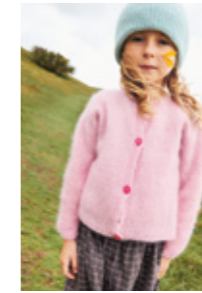
DEBUTANT CARDIGAN Tynn Silk Mohair x2 Design 2