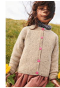
DEBUTANT CARDIGAN TWEED EDITION Tweed Recycled Design 1