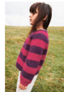
DEBUTANT CARDIGAN STRIPE EDITION Tynn Silk Mohair x2 Design 8