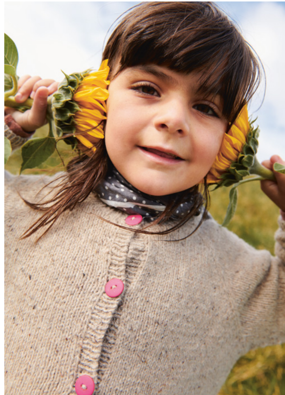
2309 | TWEED RECYCLED | \times 3½ | \frac{\text{---}}{21} | DEBUTANT CARDIGAN TWEED EDITION 1A OGB | 21 | 10 | 2 - 12 ÅR (ovenfra og ned eller nedenfra og opp)