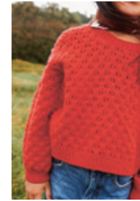
MOA GENSER Double Sunday Design 4