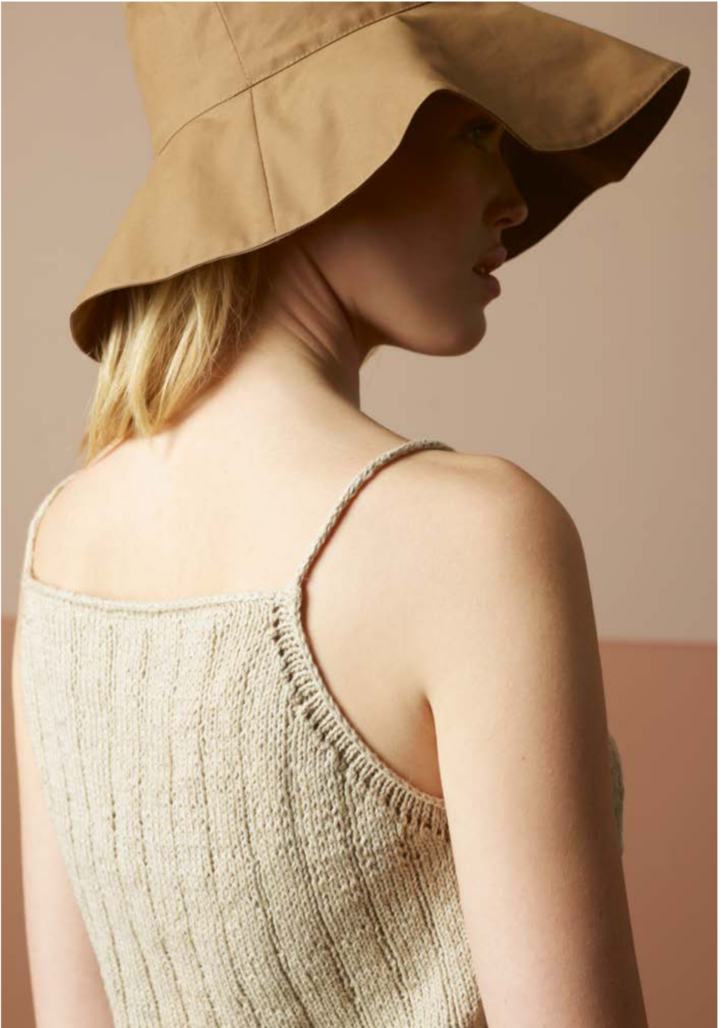
297-2 Singlet i Pelini