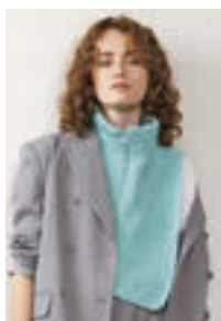
ZOE ZIPPER HALS Tynn Peer Gynt Tynn Silk Mohair Design 6