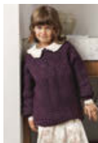
GUERNSEY GENSER Tynn Peer Gynt Tynn Silk Mohair Design 9