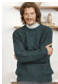
GUERNSEY GENSER Tynn Peer Gynt Alpakka Følgetråd Design 10