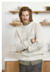
GUERNSEY GENSER Tynn Peer Gynt Design 11