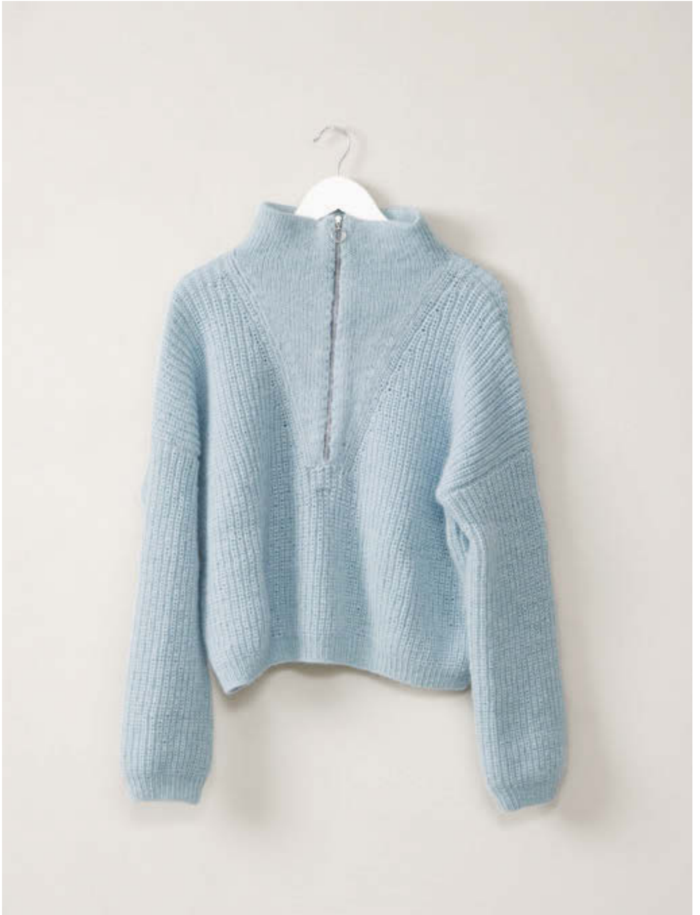
7_ ZOE ZIPPER GENSER •••• / XS-3XL / TYNN PEER GYNT & TYNN SILK MOHAIR / STRIKKEFASTHET 19/10 / PINNE 3½ / OVENFRA OG NED