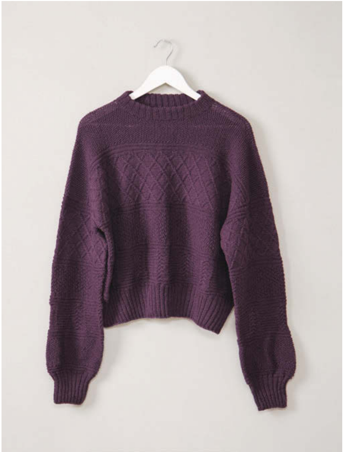
13_ GUERNSEY GENSER •••• / XS-5XL / TYNN PEER GYNT / STRIKKEFASTHET 27/10 / PINNE 3 / OVENFRA OG NED