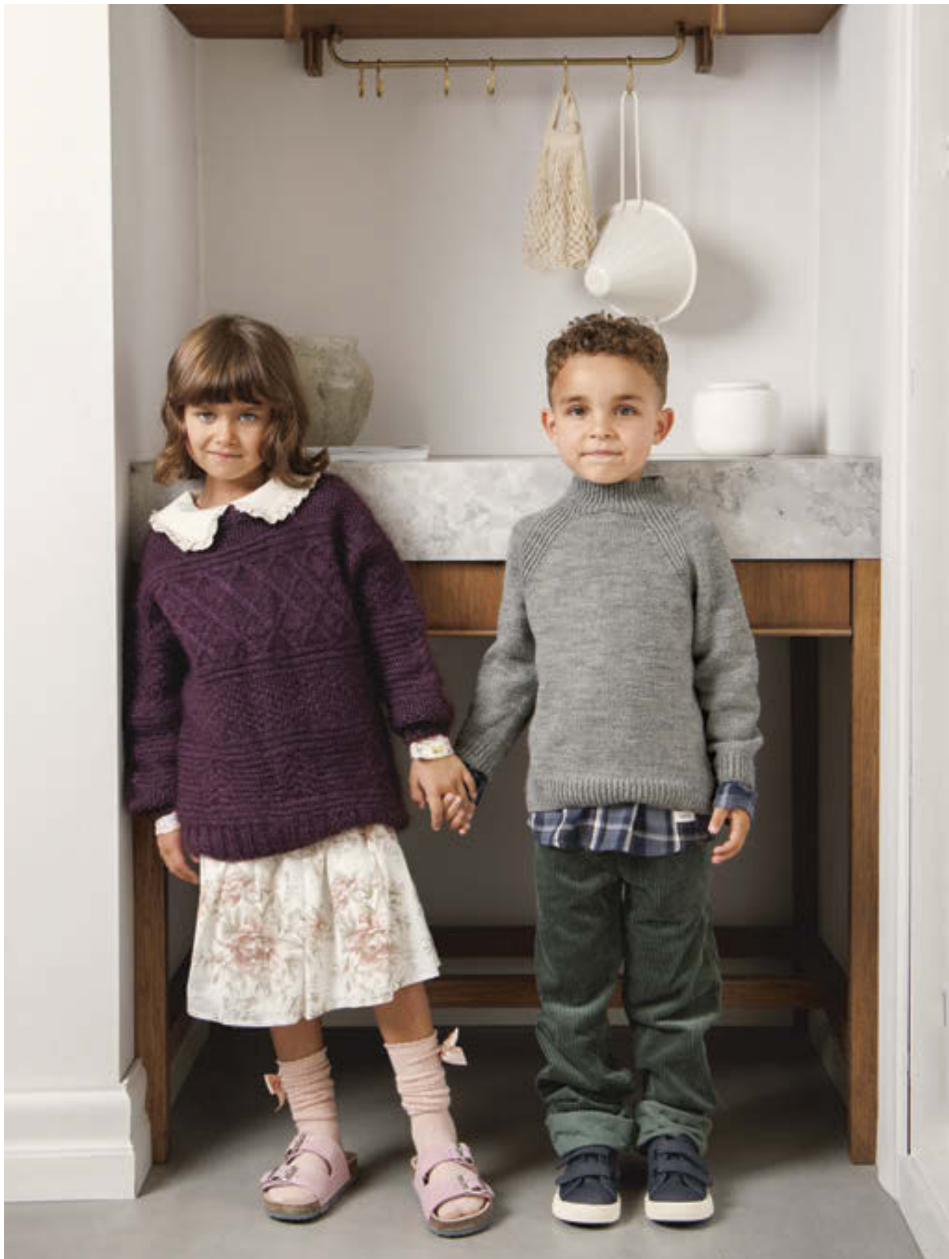
9_ GUERNSEY GENSER •••• / 2-12 ÅR / TYNN PEER GYNT & TYNN SILK MOHAIR / STRIKKEFASTHET 21/10 / PINNE 4 / OVENFRA OG NED