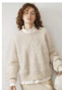
GUERNSEY GENSER Tynn Peer Gynt Tynn Silk Mohair Design 8