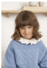
GUERNSEY GENSER Tynn Peer Gynt Design 12