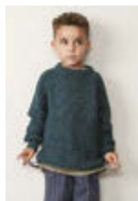
GUERNSEY GENSER Tynn Peer Gynt Alpakka Følgetråd Design 9