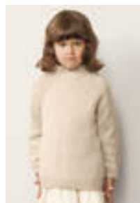
KELLY GENSER Tynn Peer Gynt Alpakka Følgetråd Design 5