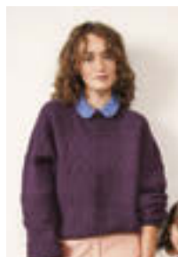
GUERNSEY GENSER Tynn Peer Gynt Design 13