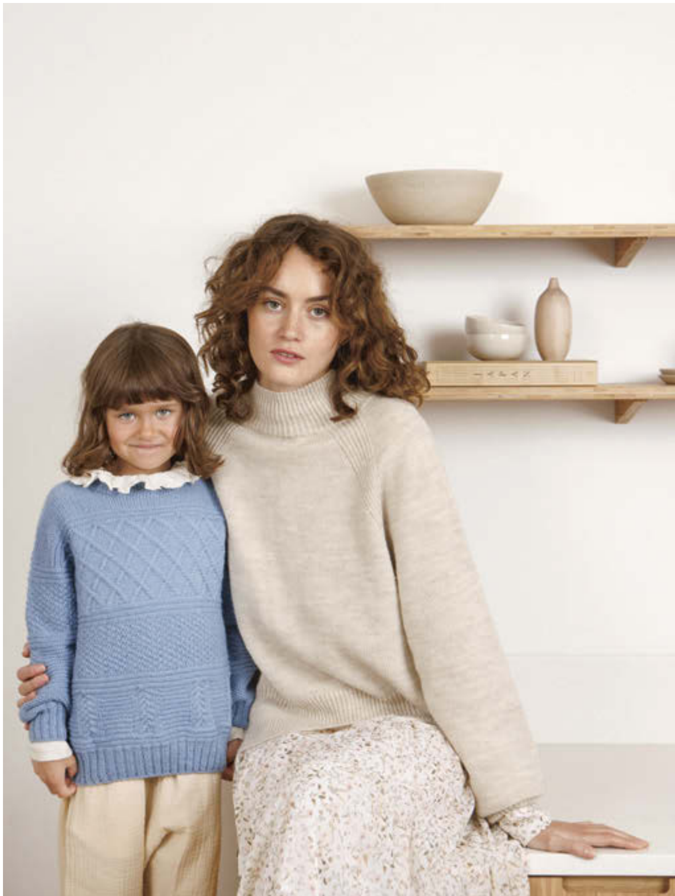
12_ GUERNSEY GENSER ••• / 2-12 ÅR / TYNN PEER GYNT / STRIKKEFASTHET 27/10 / PINNE 3 / OVENFRA OG NED