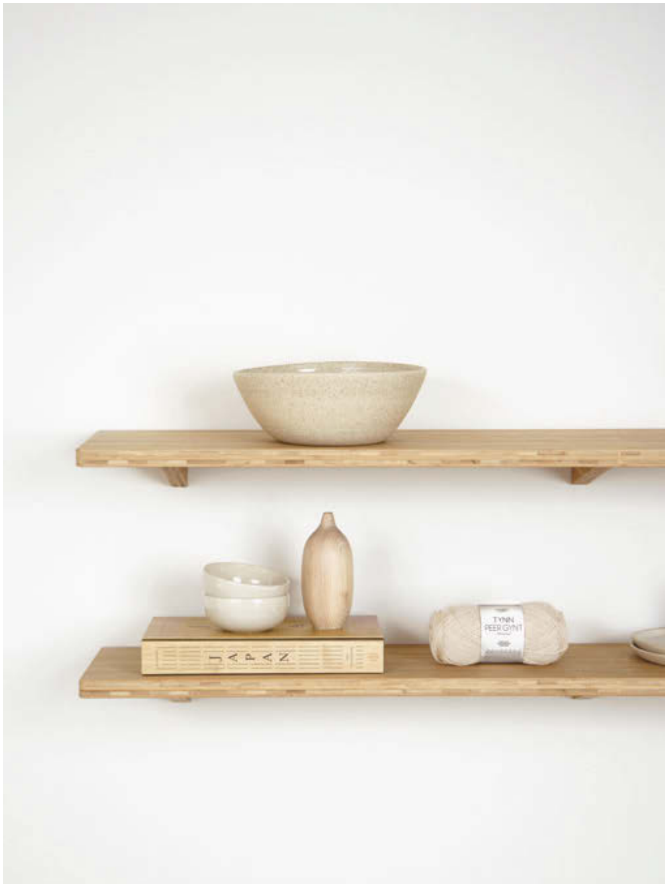
1 _ KELLY GENSER •• / 2XS-4XL / TYNN PEER GYNT / STRIKKEFASTHET 27/10 / PINNE 3 / OVENFRA OG NED eller NEDENFRA OG OPP