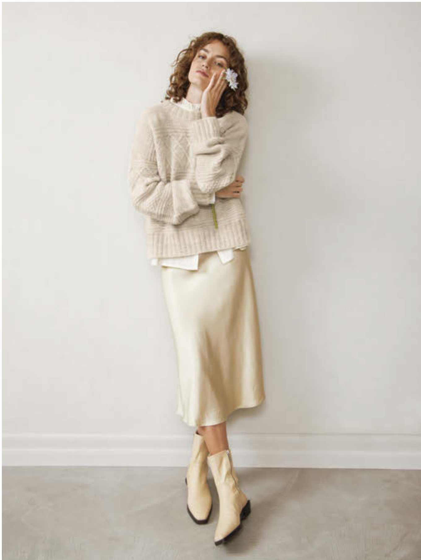
8_ GUERNSEY GENSER •••• / XS-5XL / TYNN PEER GYNT & TYNN SILK MOHAIR / STRIKKEFASTHET 21/10 / PINNE 4 / OVENFRA OG NED