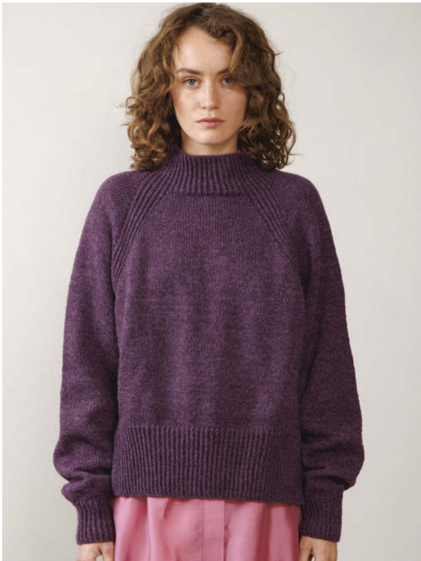
4_ KELLY GENSER •• / 2XS-4XL / TYNN PEER GYNT & ALPAKKA FØLGETRÅD / STRIKKEFASTHET 21/10 / PINNE 4 / OVENFRA OG NED eller NEDENFRA OG OPP