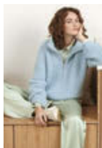
ZOE ZIPPER GENSER Tynn Peer Gynt Tynn Silk Mohair Design 7