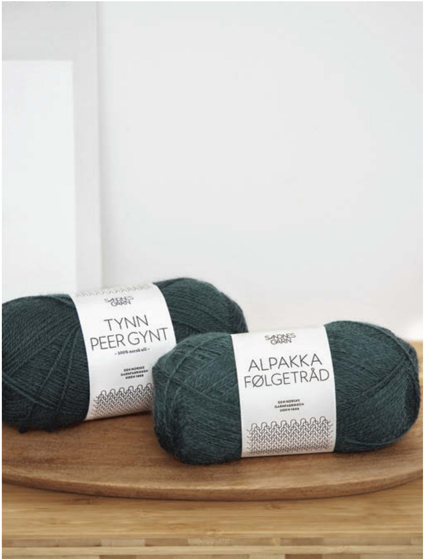
9_ GUERNEY GENSER •••• / 2-12 ÅR / TYNN PEER GYNT & ALPAKKA FØLGETRÅD / STRIKKEFASTHET 21/10 / PINNE 4 / OVENFRA OG NED