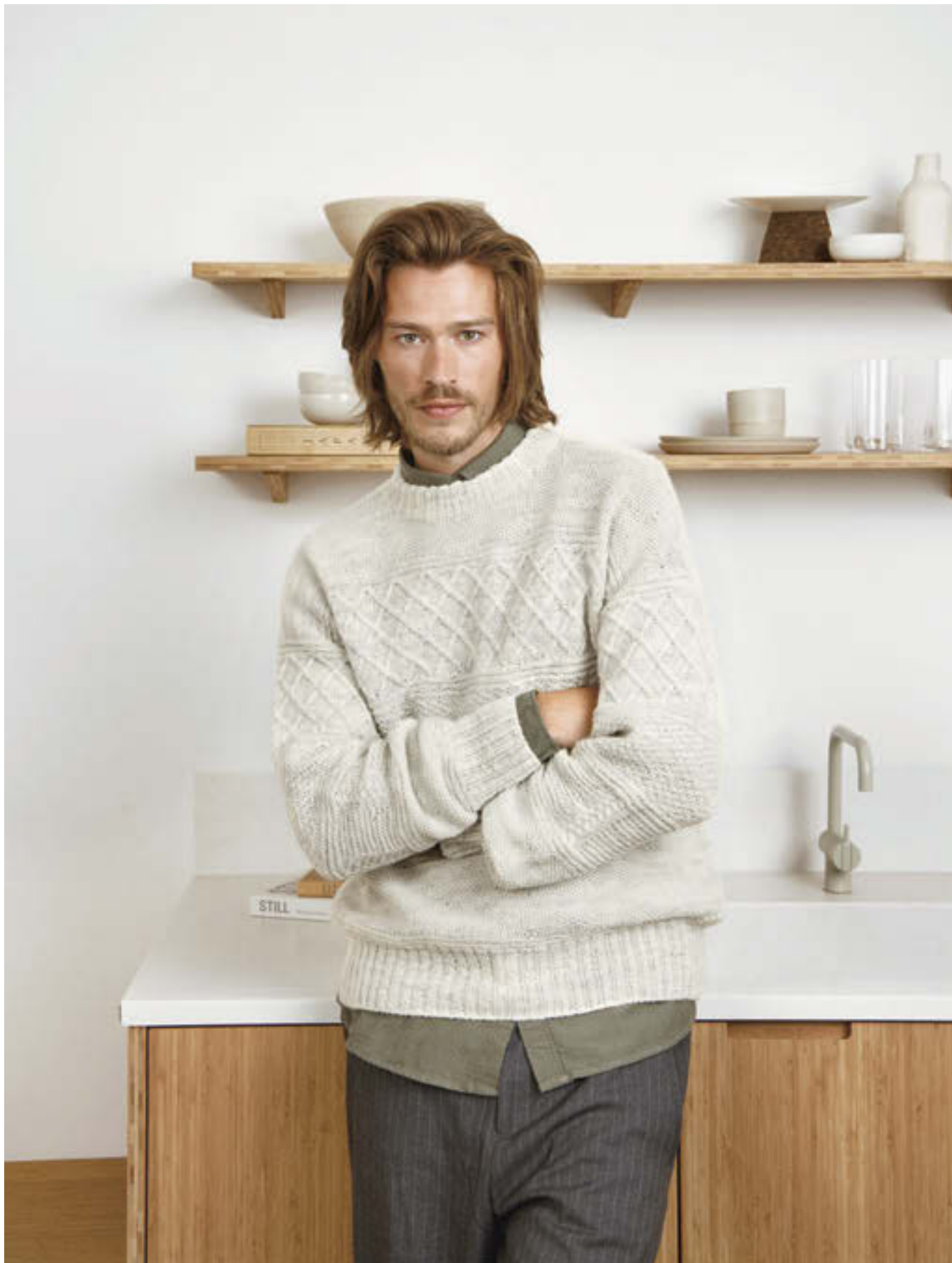
11L GUERNSEY GENSER •••• / S-5XL / TYNN PEER GYNT / STRIKKEFASTHET 27/10 / PINNE 3 / OVENFRA OG NED