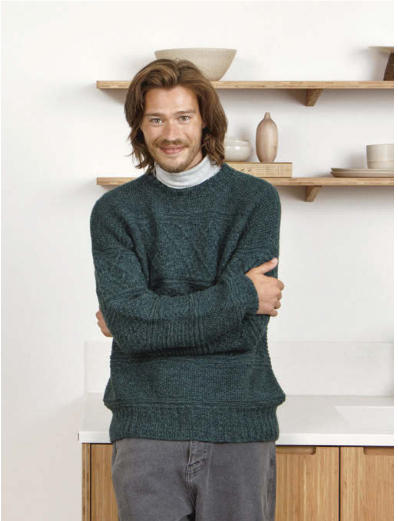
10_ GUERNSEY GENSER •••• / S-5XL / TYNN PEER GYNT & ALPAKKA FØLGETRÅD / STRIKKEFASTHET 21/10 / PINNE 4 / OVENFRA OG NED