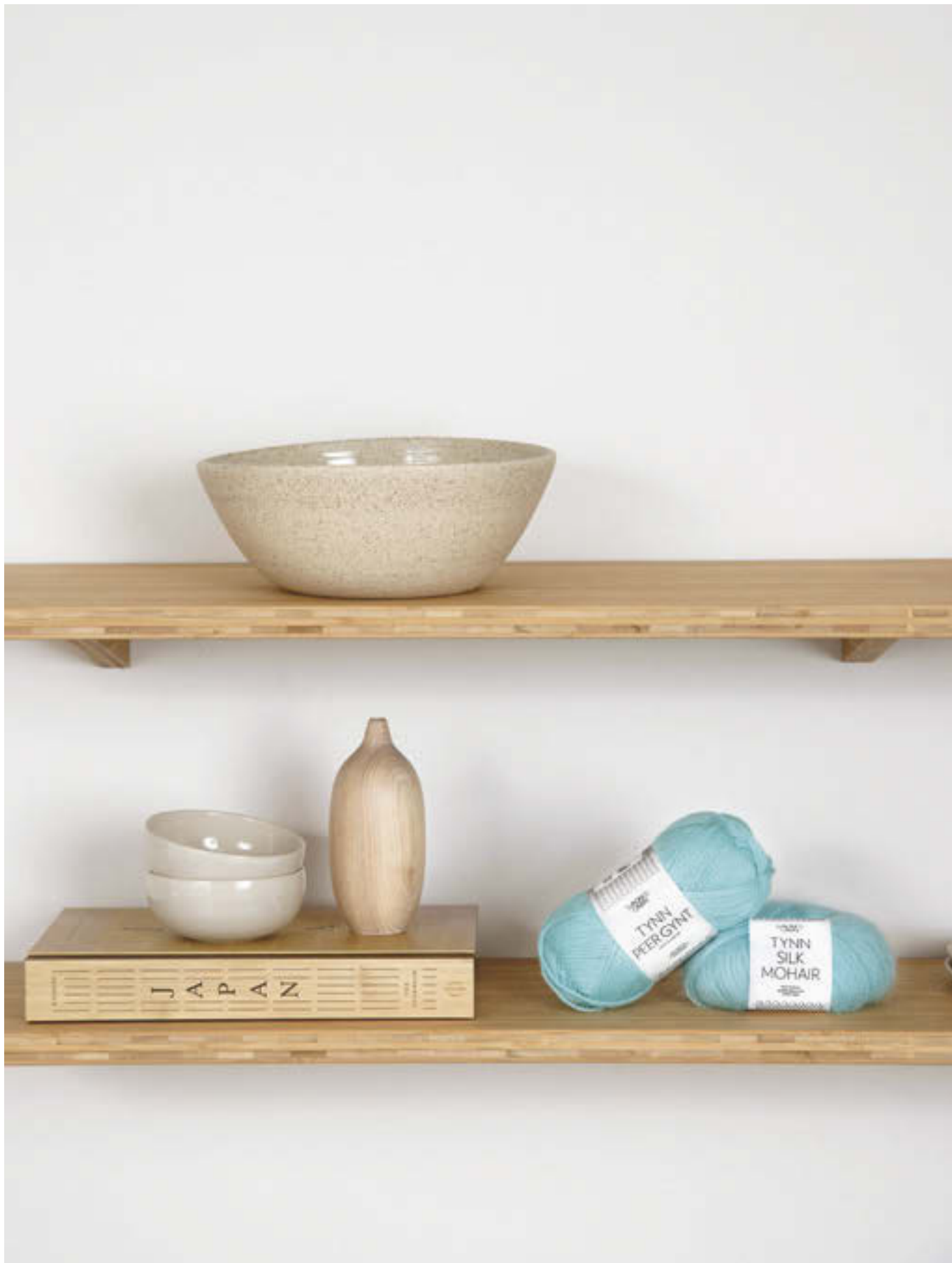
6_ ZOE ZIPPER HALS ..... / ONESIZE / TYNN PEER GYNT & TYNN SILK MOHAIR / STRIKKEFASTHET 19/10 / PINNE 3½ / OVENFRA OG NED