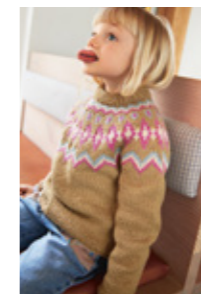
STORMGENSER Smart Design 6