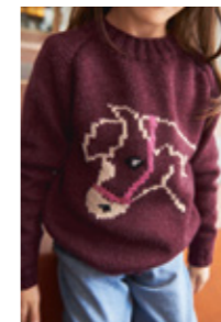
PONNYGENSER Smart Design 9