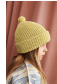
LUNARIBBLUE Merinoull Design 2