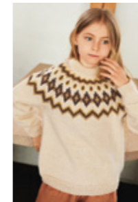
STORMGENSER Smart Design 1