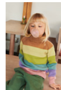
STINUS STRIPEGENSER Merinoull Design 5