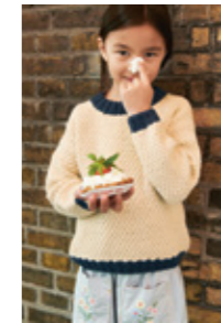
ANGUSGENSER Smart Design 3