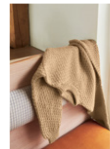
OLEGENSER Smart Design 7