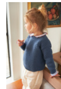
OLEGENSER Merinoull Design 7