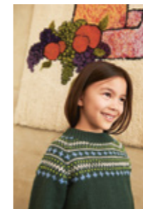
KRISGENSER Merinoull Design 8