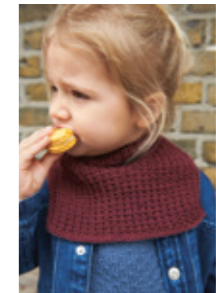
LUNA PERLERIBB- HALS Merinoull Design 4